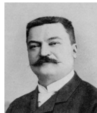
F.É.A. Lucas 1842 – 1891

Zum Abschluss möchte ich noch erklären, wie man Mersenne-Zahlen , das sind Zahlen der Form M_p = 2^p - 1 mit p prim, auf Primalität testen kann. (Ist der Exponent n von 2 keine Primzahl, dann kann 2^n - 1 nicht prim sein.) Dazu verwendet man, wie oben angedeutet, eine Variante des Pocklington-Lehmer-Tests, die mit einer Gruppe der Ordnung N + 1 arbeitet. (Sei N prim, dann kann man den Körper \mathbb{F}_{N^2} betrachten. Seine multiplikative Gruppe \mathbb{F}_{N^2}^\times ist zyklisch und hat die Ordnung N^2 - 1 = (N - 1)(N + 1) , hat also eine ebenfalls zyklische Untergruppe der Ordnung N + 1 .) Sein Spezialfall für Mersenne-Zahlen ist der Lucas-Lehmer-Test, der auf folgender Aussage beruht: