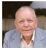
D.H. Lehmer 1905 – 1991